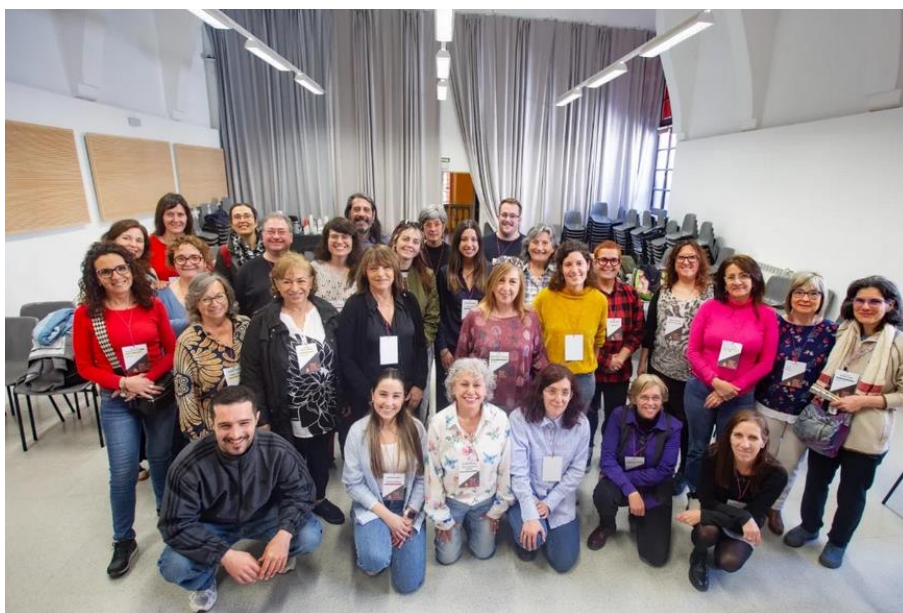
Foto: 29 de març 2025, Fòrum Social de la Cura de Valls i l'Alt Camp, un espai de trobada per reflexionar, compartir i construir un futur més just i digne per a totes les persones que realitzen tasques de cura.